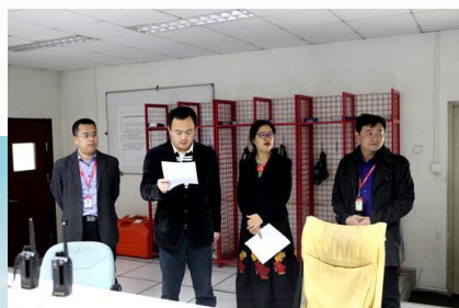
公司领导发布演习命令

公司安全管理隐患排查治理工作已实现规范化、制度化。安全生产工作委员会对相关单位进行不定期安全生产突击检查，对检查中发现的任何安全隐患绝不姑息和迁就，逐项要求限期整改，确保整改到位、隐患消除。日常在消防安全、日常安保、建筑施工安全等方面扎实开展定期、节假日、汛期、重大会议期间等各类形式安全检查，切实推动安全隐患排查治理机制化、常态化。