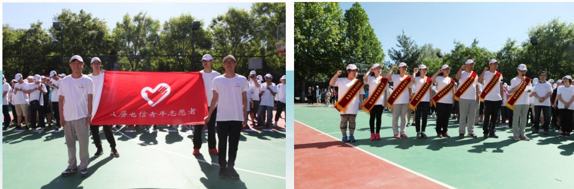
公司青年志愿者青年代表宣誓

完成了初中学业。后续为了帮助更多的贫困学生解除学习上的后顾之忧，公司员工再次为该校贫困学生捐资助学，奉献爱心，将大唐电信的爱心与正能量源源不断进行传递到贫困地区。