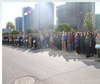
大唐电信微型消防工作站灭火演练 演习疏散集合现场