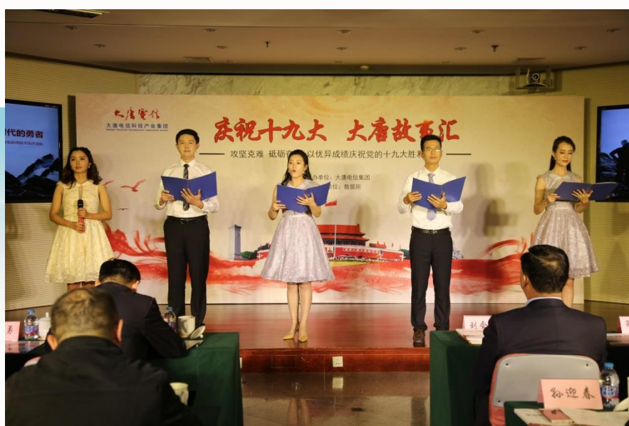
大唐电信参加“庆祝十九大 大唐故事汇”活动