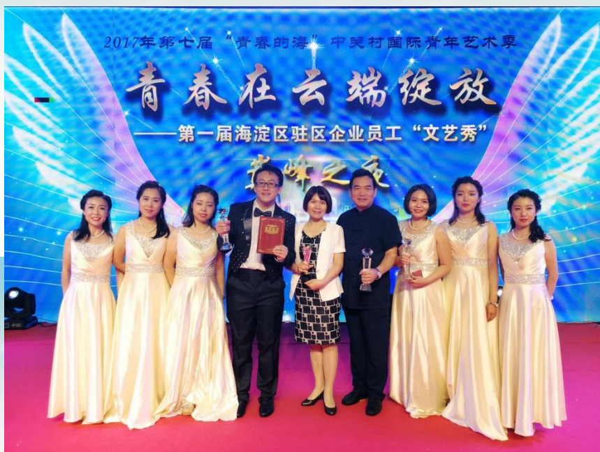
大唐电信在首届海淀区驻区企业文艺秀上荣获集体一等奖“金鹰奖”