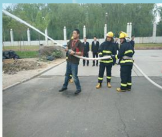
大唐电信微型消防工作站日常演练